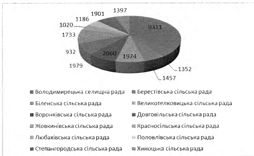
Рис. 1. Структура населення Володимирецької селищної територіальної громади у розрізі населених пунктів (сільських рад)

Чисельність населення Володимирецької територіальної громади складає 26302 осіб і за останні шість років характеризується позитивною динамікою як в цілому, так і в розрізі населених пунктів громади (Рис.1). Середньорічний темп приросту чисельності населення громади за 2010-2020 роки становить 0,5 %.